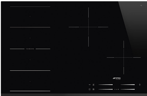
Table de cuisson, Esthétique: Universelle, Induction, 78 cm, Type d'encastrement: Semi-affleurant